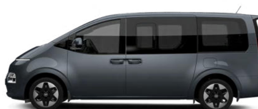
Graphite Gray Metallic