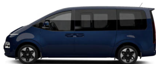
Moonlight Blue Pearl