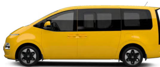
Dynamic Yellow nur für Transporter verfügbar