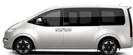
Shimmering Silver Metallic