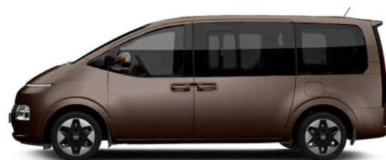
Gaia Brown Pearl nur für Bus verfügbar