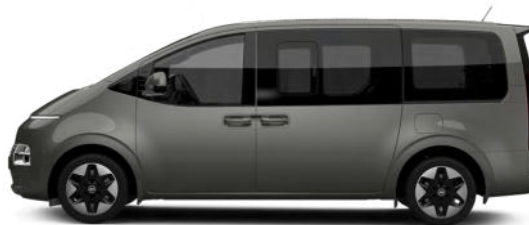
Olivine Gray Metallic nur für Bus verfügbar